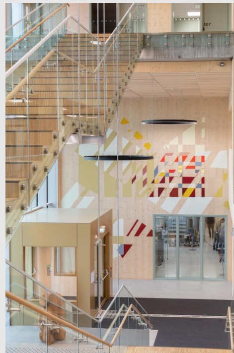
Kunster: Tine Aamodt Tittel: Kaleidoskop