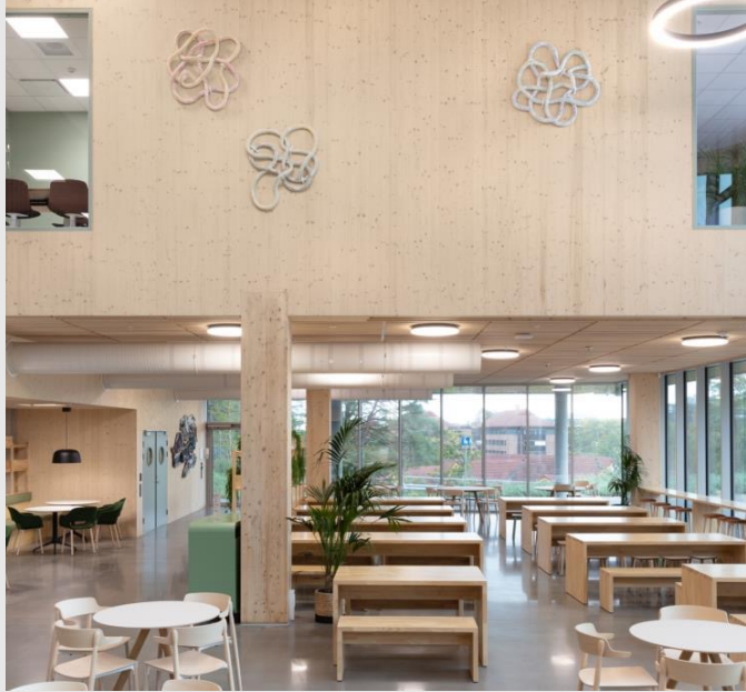
Kunster: Hågen Gade