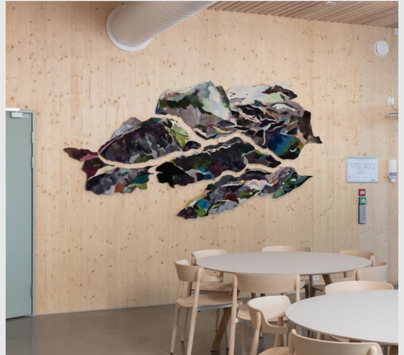
Kunstner: Ingrid Aarset Berge