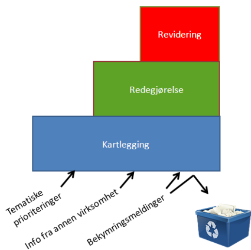
Figur 1. Tilsynsmodellen. Modellen gir en oversikt over de tre trinnene i tilsyn med eksisterende virksomhet.

Utvelgelsen av hvilke studier og institusjoner som kartlegges kan være bestemt ut fra en tematisk prioritering, og/eller informasjon fra annen virksomhet. Det kan også være bekymringsmeldinger som NOKUT har mottatt som utløser kartleggingen.